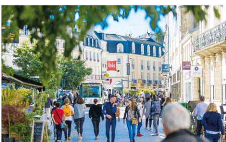
CENTRE VILLE DE POITIERS