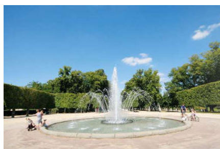
PARC DE BLOSSAC